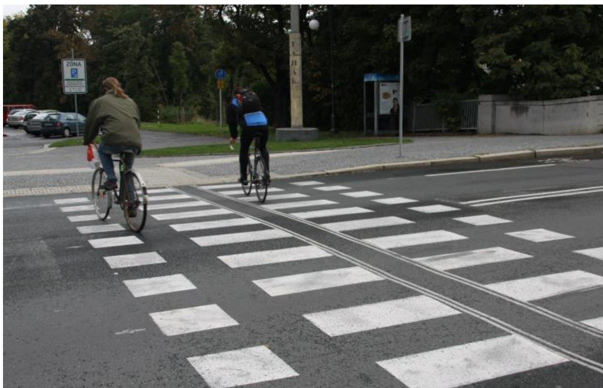
ukázka zkušebního řešení z Pardubic (Varianta 3)